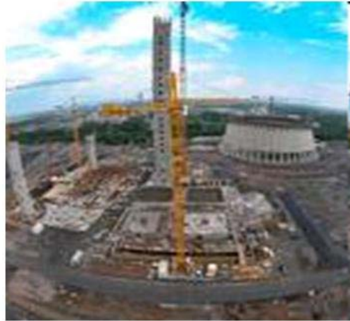
Steinkohle- kraftwerk Lünen